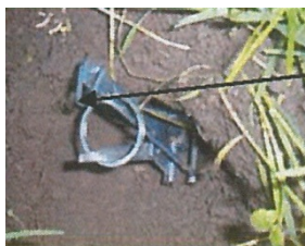
Nettoyer le trou, introduire Le tue taupe et vérifier que le déclencheur coulisse bien en le manœuvrant de haut en bas