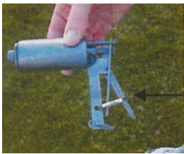
Prendre le tue taupe Et mettre l'anneau de sécurité