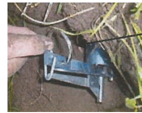
Enlever l'anneau de sécurité