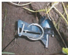
Armer le tue taupe en plaçant la tige du percuteur dans le déclencheur