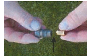
Mettre une cartouche à blanc et revisser l'embout